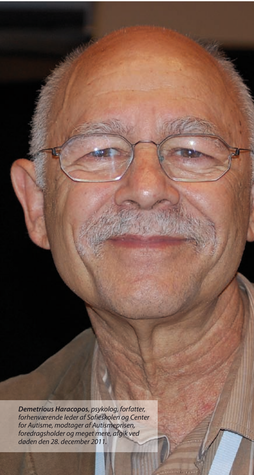
Demetrious Haracopos, psykolog, forfatter, forhenværende leder af Sofieskolen og Center for Autisme, modtager af Autismeprisen, foredragsholder og meget mere, afgik ved døden den 28. december 2011.