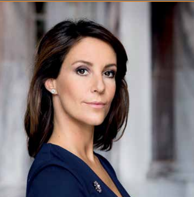
Hendes Kongelige Højhed Prinsesse Marie er protektor for Landsforeningen Autisme.

” Landsforeningen Autisme blev stiftet af en gruppe forældre i 1962.