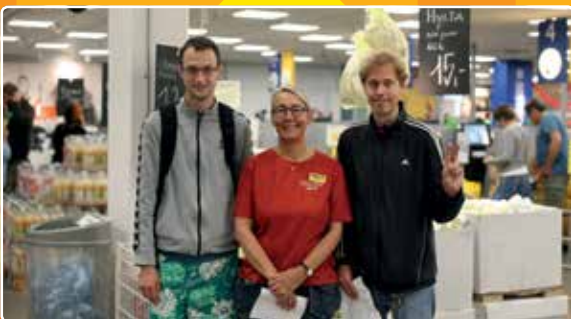
Kom godt fra start side 10