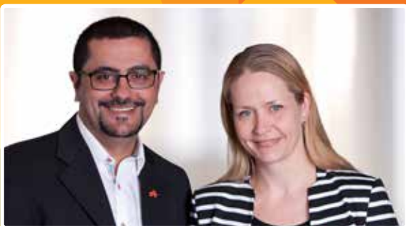
At flytte hjemmefra side 4