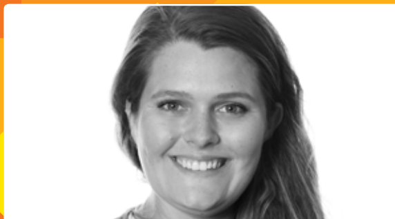
Hvor og hvordan kan man bo? side 14